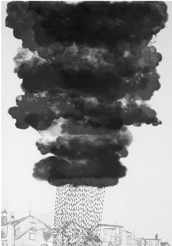
La Nuage qui menace , 2003 stone litho 76 x 52 cm